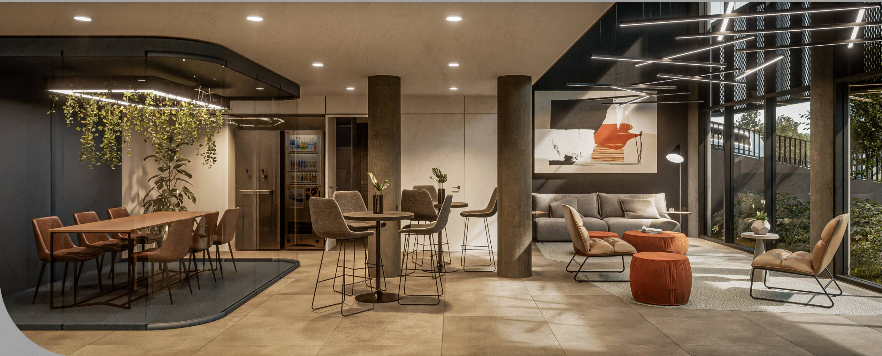
Lounge de Entrada